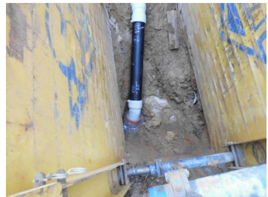
Während der Bauarbeiten

Ein wichtiger Aspekt war die Bürgerinformation von Beginn an und die Berücksichtigung der Belange der Anlieger im Bauablauf. Zusätzlich wurde auf den Busverkehr und die Funktion der B56 (Rheinstraße) als überörtliche Verkehrsader Rücksicht genommen.