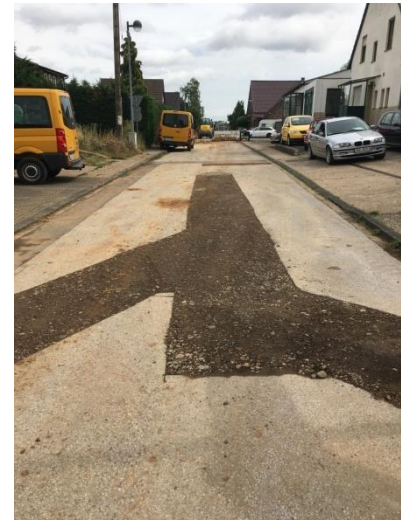
Erneuerung Anschlüsse im Tiefbau

Nach den Tiefbauarbeiten wurden die Oberflächen in Kanalgrabenbreite bzw. im Bereich der Kopfflächen wiederhergestellt. Lediglich in einer Straße erfolgte ein kompletter Straßenbau